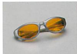
保護メガネ(サンクラスタイプ) 包装・希望医院価格●1個=¥8,500