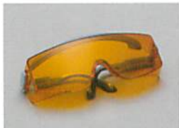
保護メガネ(オーバークラスタイプ) メガネの上から装着できます。 包装・希望医院価格●1個=¥7,000