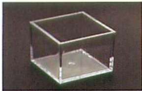
ワッテガーゼボックス (1個)