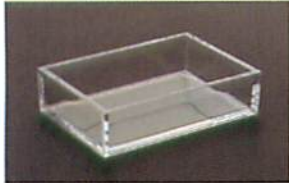
ハンドピースボックス (1個)