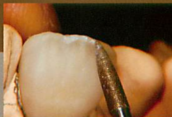
唇側面細部の修整