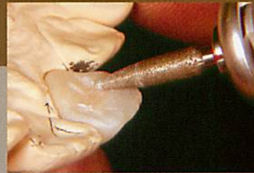
舌側面辺縁隆線の付与