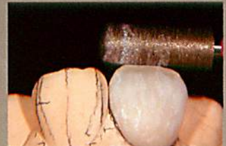
直線部を利用した研削