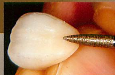
唇側面V字溝の調整