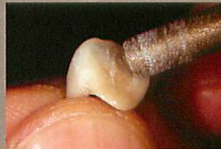
舌側面の凹面部の付与