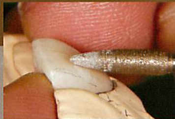
唇側面隆線の付与