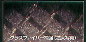
グラスファイバー補強 (拡大写真)

グラスファイバー補強により強化されたディスクだから、 切削中も、取り付け中も、割れにくい。