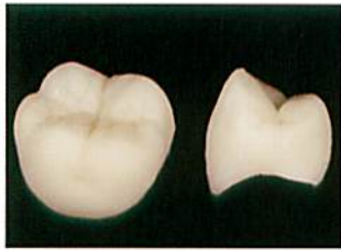
プレス成型後のクラウン

また、歯科用セラミックスフレーム材(アルミナ、ジルコニア)およびプレス用セラミックスやCAD/CAM用ポーセレンブロック、既製陶歯などの歯科用セラミックス材料に幅広く使用することができます。