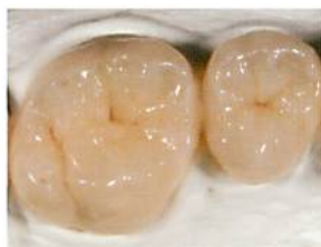
小窩裂溝にブラックブラウンや ダークレッドブラウンを使用*

特にシェードステインのグループには、セラミックス修復物用の外部ステインとセラミックスフレーム用の内部ステインの2系統を用意し、精度の高い色調再現を可能にしています。*:グレーシングペーストを含む