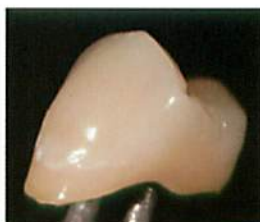
脱灰部にコーンイエロー およびホワイトを使用*