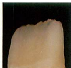
切端部にブルーおよび ブルーグレーを使用