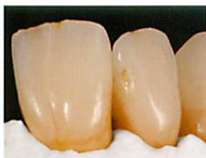
ヘアライン・クラックライン部に ブラウンおよびホワイトを使用**