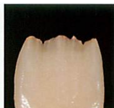
マメロン構造部に マメロンピンクを使用