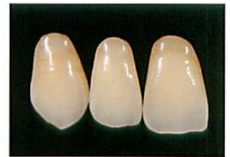
形態修整および色調調整後