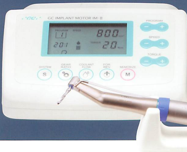
インプラント用マイクロモーター ジーシー インプラントモーターIM-II