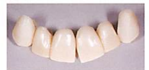
撤去したプロビジョナル