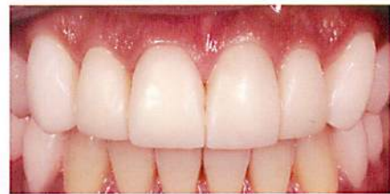
口腔内装着4週間後