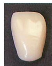
光沢感がUP! 舌感もなめらかに