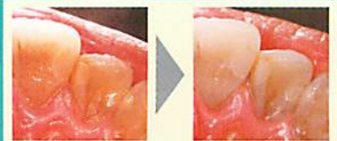
軽度のステインも除去できます