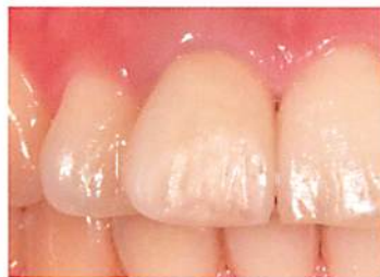
ツヤを失った補綴・修復物