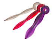
ウェーブウェッジ 白：スモール 赤：ミディアム 紫：ラージ