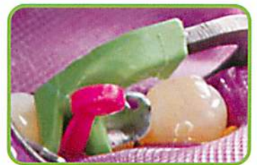
4. タブマトリックスと、ウェーブウェッジをV3リングで固定