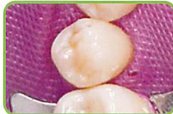
7. 形態修正、および研磨