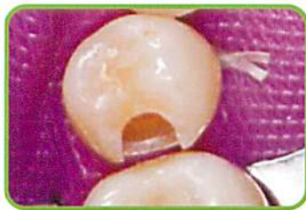
1. 通法に従って高洞形成