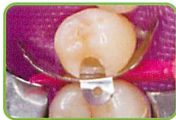
2. ピンツィーザーでタブマトリックスを把持し、セット後ウェーブウェッジを挿入