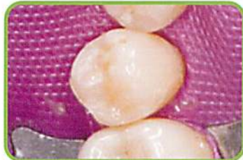
6. CRを重合させた後、V3リング、ウェーブウェッジ、タブマトリックスを撤去