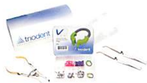
V3リング スターターパック