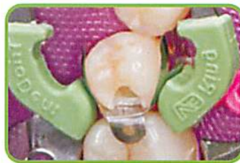
3. フォーセプスでV3リングを把持し、セット