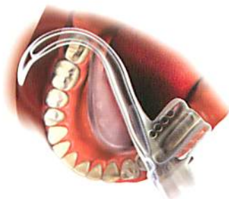
下顎右側診療時使用例