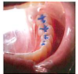
LED光源内蔵のコントロールヘッド マウスピースを通して光が拡散 明るく照らし出された術野