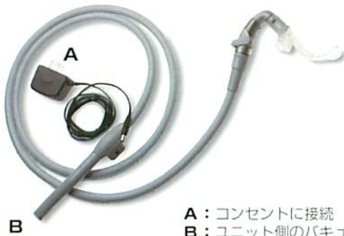
A : コンセントに接続 B : ユニット側のバキュームホースに接続