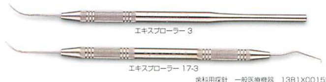
エキスポローラー 3