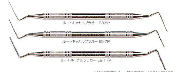
ルートキャナルプラグー E3-5P