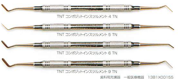
TNT コンポジットインスツルメント 4 TN