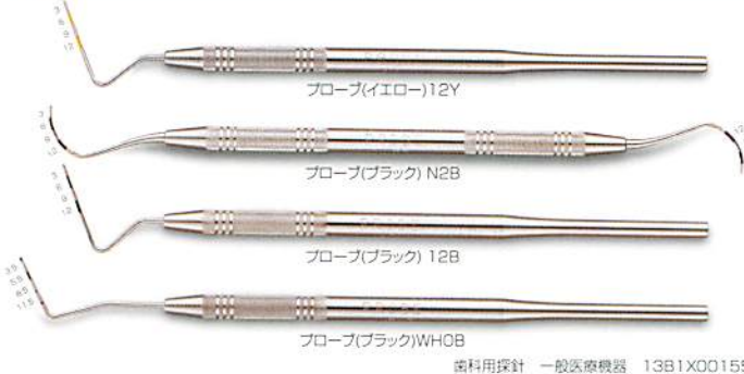
プローブ(イエロー)12Y