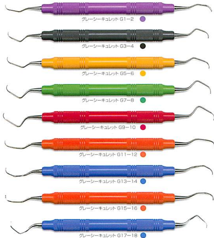
グレイシーキュレット G1-2