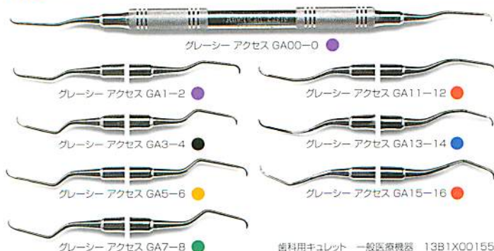
グレイシー アクセス GA00-0