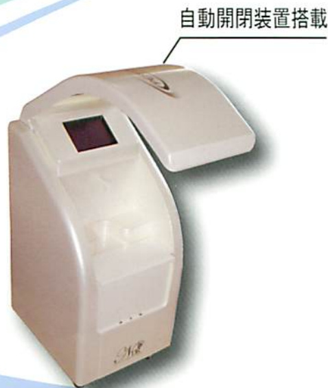
自動開閉装置搭載

パーフェクトペリオ 生成溶液(1 Liter入り×4本) ¥31,200(税別)